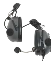
RMN4053 – Náhlavní sada montovaná do ochranné přílby s pasivními chrániči sluchu (šedá)