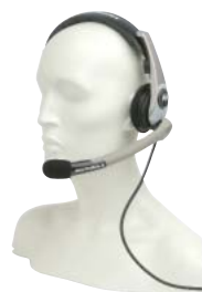
RLN5238 – Středně těžká náhlavní sada (typ stadion) s PTT