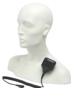
HMN9030 – Externí reproduktor/mikrofon