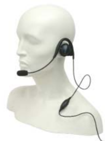
MDPMLN4444 – Flexibilní náušní sada MAG ONE s vestavěným tlačítkem PTT/VOX