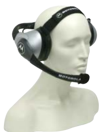
RMN5015 – Těžká závodní náhlavní sada (vyžaduje kabel adaptéru náhlavní sady RKN4090)