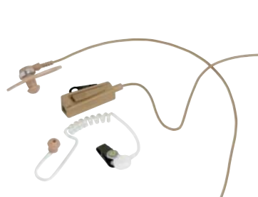
HMN9754 – Kombinované dvoudrátové sluchátko s mikrofonem a PTT (běžové), NTN8371 – Transparentní zvukovod