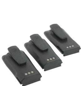
Li Ion, NiCd and NiMH batteries