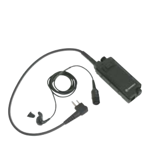
BDN6646 – Náhlavní sada Voiceducer s tlačítkem PTT a standardním sluchátkem