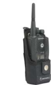
HLN9701 – Nylonové pouzdro s poučkem na opasek