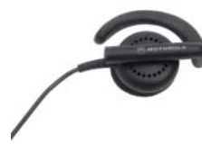
BDN6720 – Flexibilní vnější sluchátko

Radiostanice CP180 je určena pro manažery a pracovníky větších organizací. Obsahuje 64 komunikačních kanálů a nabízí tak maximální flexibilitu. Je vybavena osmiznakovým podsvětleným displejem s deseti snadno pochopitelnými ikonami. Plnohodnotná klávesnice umožňuje okamžité soukromé hovory mezi čtyřma očima nebo hovory v rámci skupiny. Usnadňuje přístup k nabídkám a seznamu kontaktů, který slouží jako adresář. Uživatel je o totožnosti volajícího informován pomocí 'identifikace kanálu', jenž se zobrazuje na displeji. Klávesnici lze přizpůsobit tak, aby umožňovala rychlé vytáčení nejčastěji volaných jednotlivců a skupin obdobně jako v případě klasického telefonu. Zámek klávesnice chrání před nechtěnými hovory a změnou nastavení v důsledku stisku klávesnice. Uživatel je tak stále v kontaktu s ostatními.